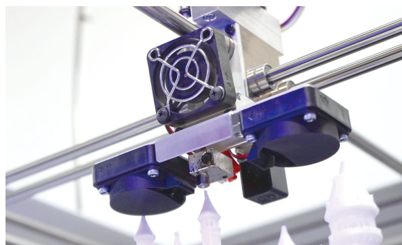
Medieval Castle by boldmachines, published Jun 11, 2015

加熱式造形テーブルを標準装備し造形物の反りを軽減。高信頼性ヘッドにより、多くのフィラメントに対応でき、メンテナンス性も抜群です。独自設計のモータードライバーにより格段に優れた静音性を実現。またフルメタルボディを使うことにより、高い剛性を実現し、安定した高精細造形を可能にしました。本製品は、設計・部品加工・組立・アフターサービスまで全て京都で行っており、長期間安心してお使いいただけます。